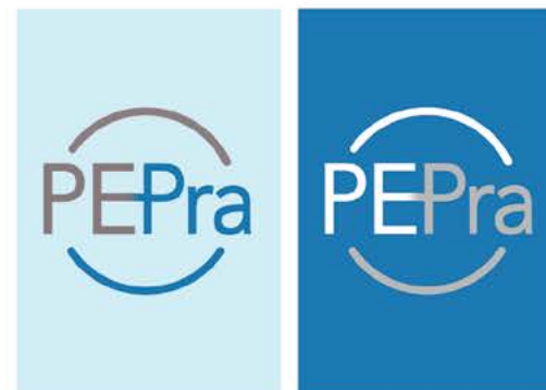
Utilisation avec fond